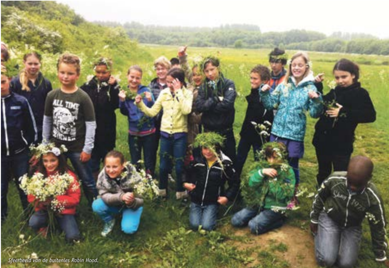
Sfeerbeeld van de buitenles Robin Hood.

BuitenWijs is het samenwerkingsverband van de gemeente Nieuwegein, Houten, IJsselstein en Lopik op het gebied van natuur- en milieueducatie. BuitenWijs verzorgt voor alle basisscholen van de vier gemeenten lessen over natuur en duurzaamheid in én buiten de klas. Voor de buitenlessen zoeken wij natuurliefhebbers die het leuk vinden om in de eigen woonomgeving met kinderen te werken. Kennis van de natuur is niet noodzakelijk, betrokkenheid met natuur wel!