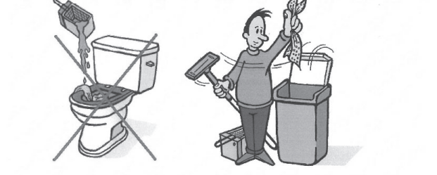
Voorkom verstopping in uw wc, uw gootsteen en het riool. Gooi wegwerpdoekjes, vet en ander vuil in de afvalbak!